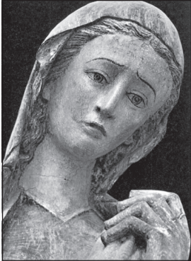
Marias ansigt 2000 års portrætter af Guds moder. Side 10